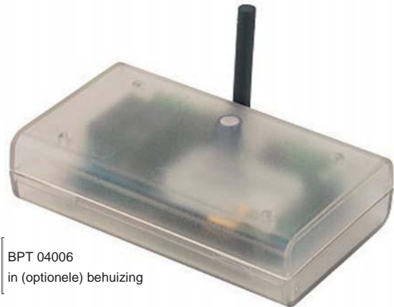
BPT 04006 in (optionele) behuizing

van buitenaf uitgesloten is. Alleen de maximaal 100 gebruikers zijn geautoriseerd om gebruik te maken van de module. Alle andere onbekende nummers worden automatisch genegeerd. De twee relais van de BPT 04006 hebben een maximale schakelstroom van 6Amp bij een maximale schakelspanning van 250Vac.