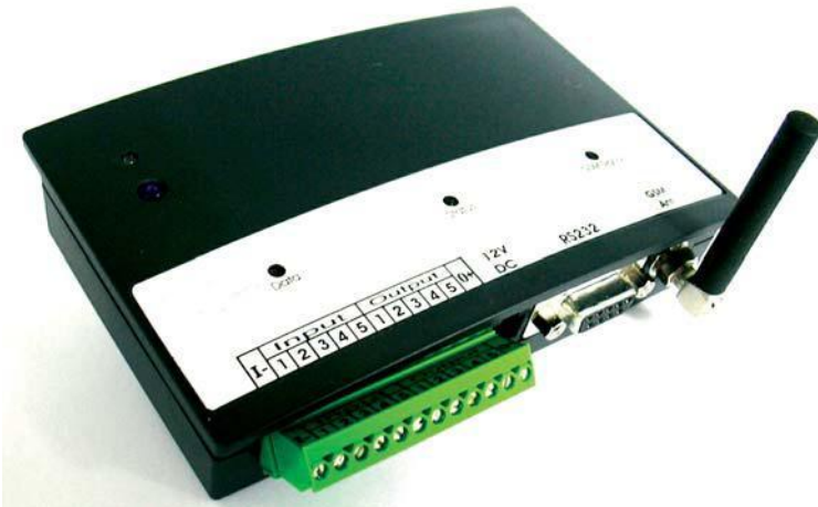
GSM-Schakelmodule BPT 04100