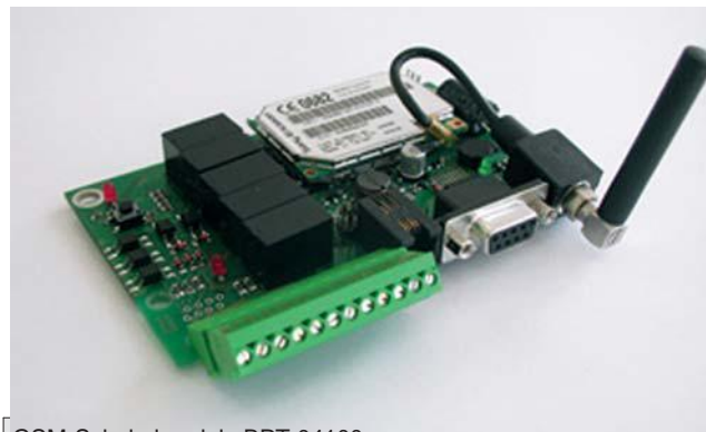
GSM-Schakelmodule BPT 04100

Voeding t.b.v. BPT 04006 en MG 04100. In: 230Vac / 0,25A Uit: 6Vdc / 1A