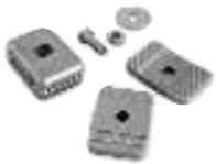
PLA13 mechanische eindaanslagen voor open en gesloten stand stuks/verpak.: 4