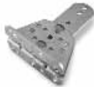
PLA14 afstelbare op te schroeven achterbeugel stuks/verpak.: 2