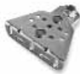
PLA15 afstelbare op te schroeven voorbeugel stuks/verpak.: 2