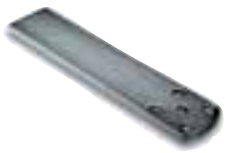
PLA6 aanlaslip lengte 250mm stuks/verpak.: 1