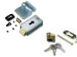
PLA10 verticaal 12V-elektrisch slot (verplicht voor vleugels langer dan 3m) stuks/verpak.: 1