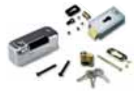
PLA11 horizontaal 12V-elektrisch slot (verplicht voor vleugels langer dan 3m) stuks/verpak.: 1